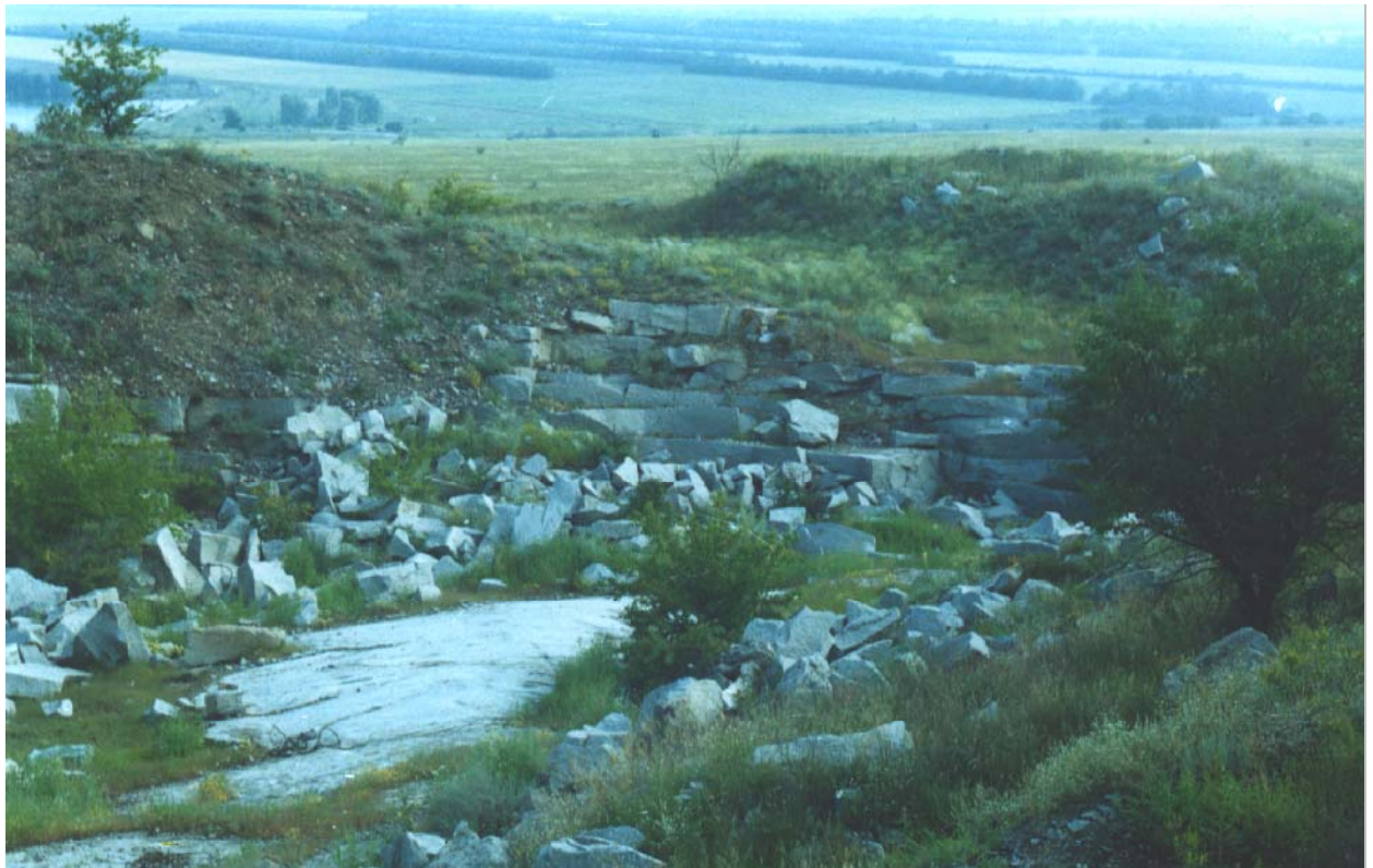
Салтичський гранітний кар'єр