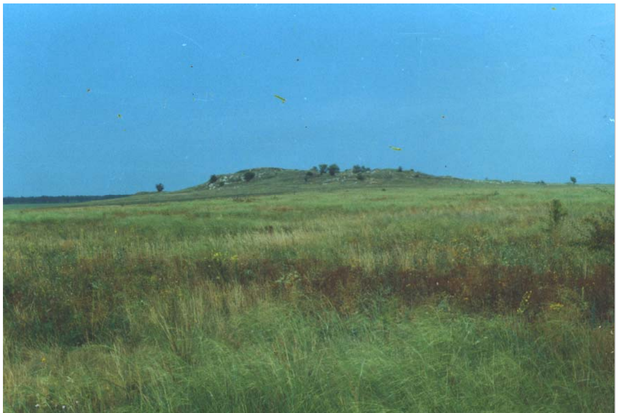
Ковиліві степи салтицьського гранітного кар'єру