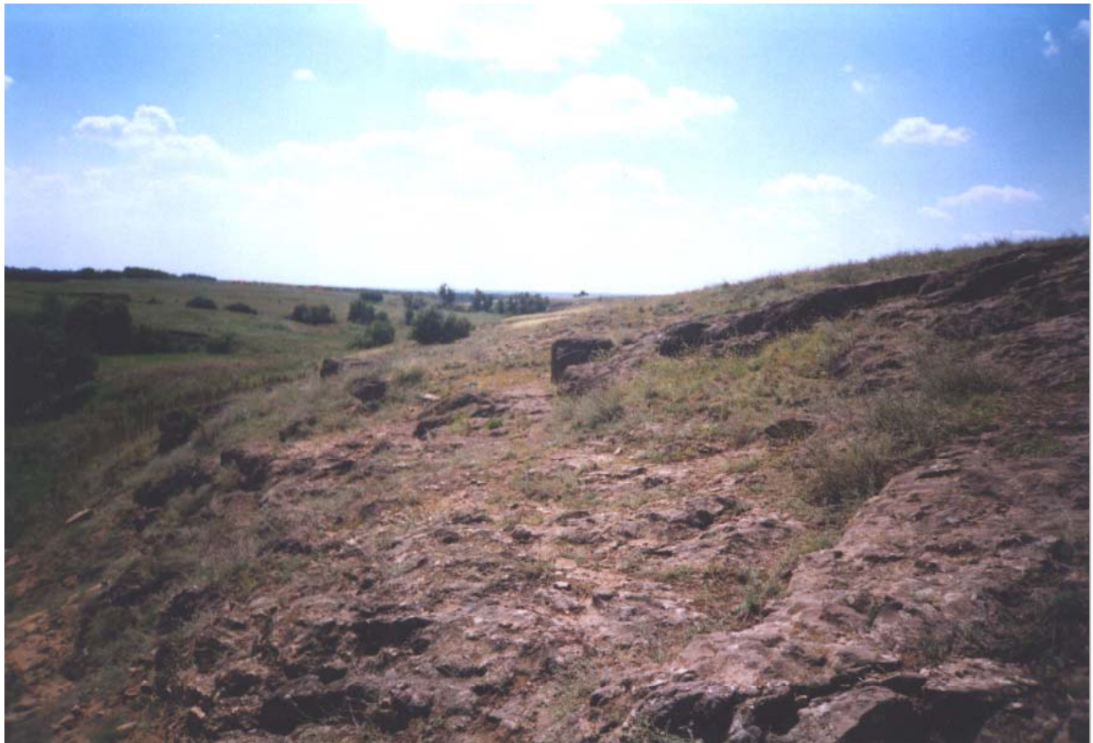
Гранітні виходи правого берега р. Грузенька