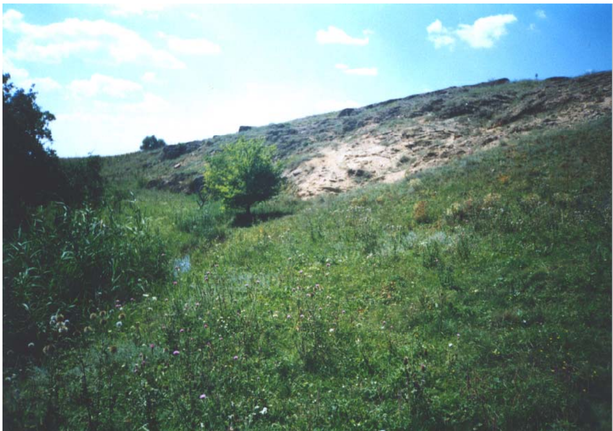
Схили біля р. Грузенької