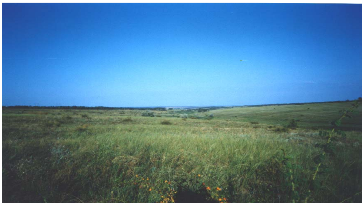
Ковилові степи в балці Воловій