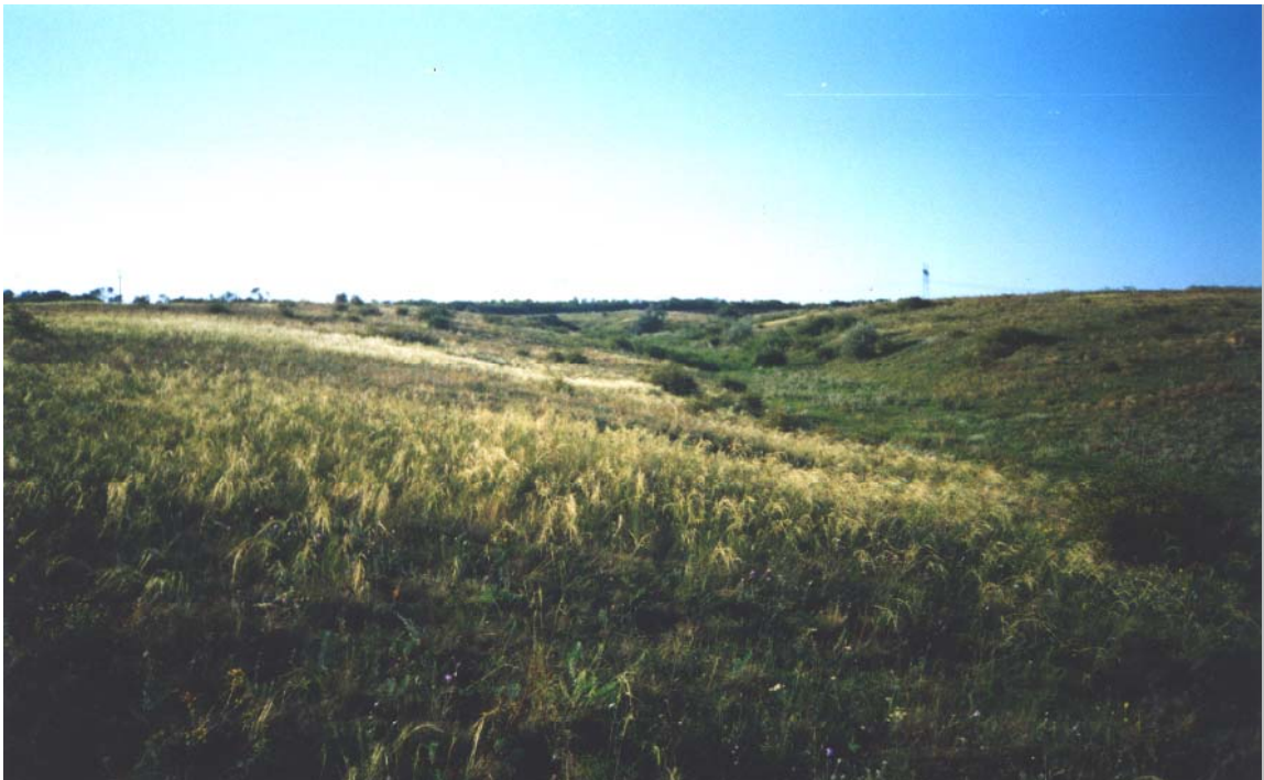
Ковилові степи в балці Воловій

Для їхнього захисту, для збереження балки Волової та екосистеми басейну р. Берда, як типової малої річки Приазовської височинної області Лівобережно-Дніпровсько-Приазовської північно-степової провінції степової фізико-географічної зони, необхідно терміново створити зазначений вище об'єкт природно-заповідного фонду.