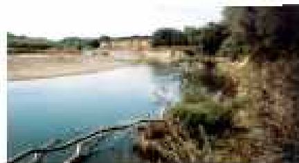
Ерозія берегової лінії річки Страбн в районі с/пос. Блажівка