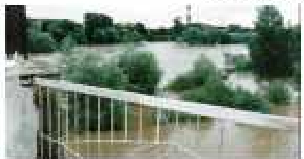
Повінь на річці Страбн