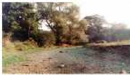
Степовий річка Тетюсарівка