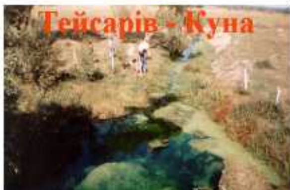
Тейсарів - Куна