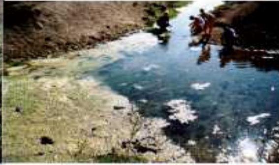
Річка Луг при впадінні в р. Дністер