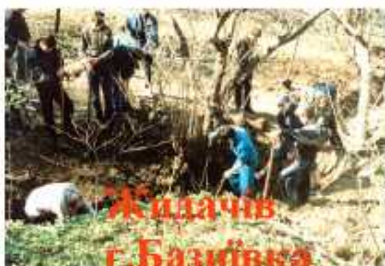
Жидачів г. Базилівка