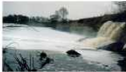
Річка Страбна-середня частина Жидачівки