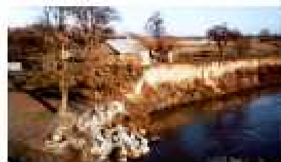
Ерозія берегової лінії річки Душтер в районі села Залісся