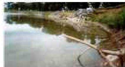
Ерозія берегової лінії річки Страбн