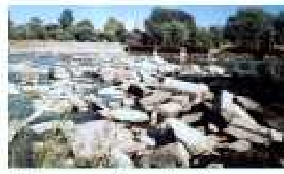
Штучна житова на річці Страбн